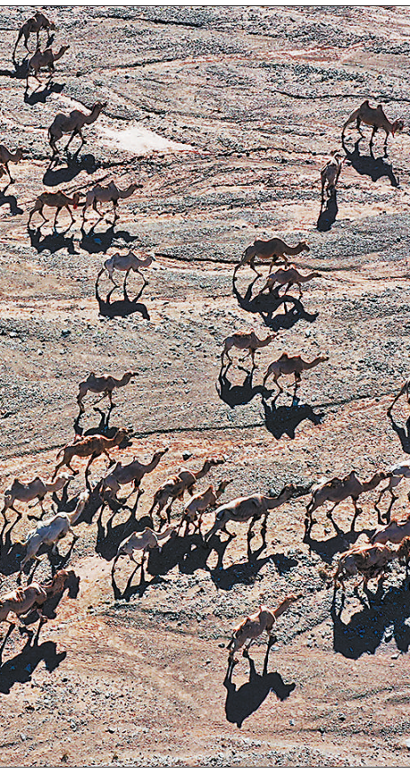
7月7日,甘肃省阿克塞哈萨克族自治县红柳湾镇加尔乌宗村牧民饲养的数百头骆驼前往夏季牧场。