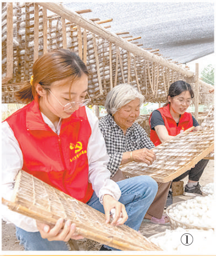
图①:江苏省泗洪县,党员志愿者帮助蚕农蚕茧。 图②:浙江省德清县,老党员正向民警讲述党史故事。