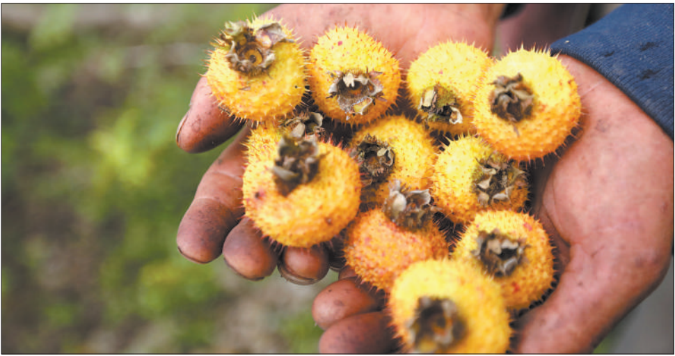
黔南龙里金灿灿的刺梨正是采摘季。

依托良好生态环境，贵州走出了一条高质量发展新路。连续5年时间，贵州绿色经济增长速度领跑全国；连续40个季度，贵州经济增速位居全国前三。