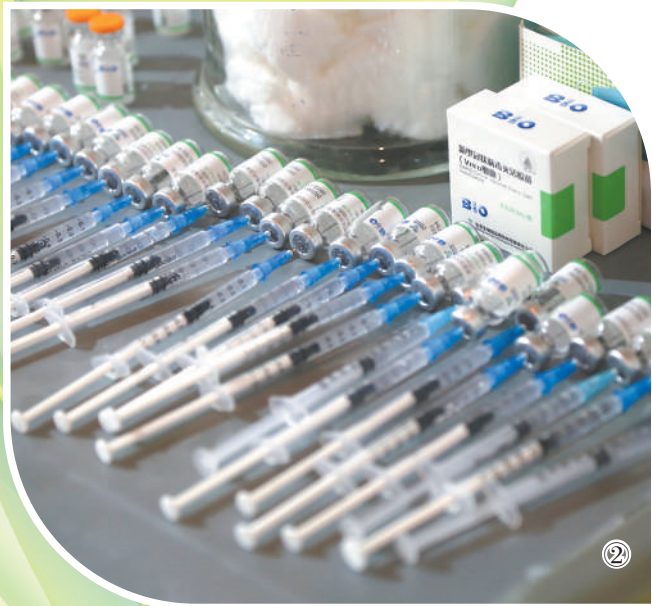
图①：2021年2月7日，一名中国公民正在巴基斯坦伊斯兰堡PEMH医院接种新冠疫苗。