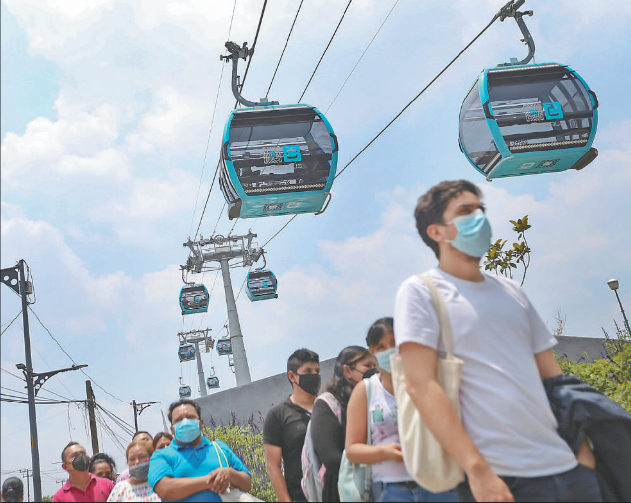
7月11日,“电缆巴士”在墨西哥首都墨西哥城正式投入运营。该条线路通过空中缆车连接墨西哥城的库奥特佩克社区和印第安贝尔德地铁站,有效减少了通勤时间。图为当天,乘客在墨西哥城排队准备乘坐“电缆巴士”。

从2019年9月到2020年8月,日本岐阜县瑞浪市的瑞浪北中学进行了一项备受瞩目的测试,最终发现,该校面积8090平方米的校舍达到零排放标准,成为日本第一所零排放的中小校园。 采用自然通风,建筑物具有高隔热、高气密性,保持室内适宜温度;利用自然采光和地热,并配备高效照明和空调系统;利用太阳能、风力等进行发电,提高可再生资源占比;利用环保监测仪进行能源管理……该校舍使用一系列清洁技术和数字技术,成为日本零排放建筑的重要尝试。 2016年,日本政府提出,到2030年实现半数新建建筑达到零排放建筑的目标。数据显示,2019年,日本住宅、办公大楼等建筑的碳排放量为3.52亿吨,占日本国内碳排放的34.4%,仅次于工业部门。日本舆论认为,为实现2050年碳中和目标,日本需要采取措施减少建筑物的碳排放。在日本2020年底宣布的绿色增长战略中,住宅建筑位列14个推进温室气体减排的重点领域。 6月3日,日本提出“为实现脱碳社会的住宅和建筑物对策方案”,规定日本国家和地方政府在建造学校、文化设施、政府大楼等公共建筑时,应安装太阳能发电设备,日本政府还将统一规定太阳能发电设备的标准。6月9日,日本政府宣布到2030年,全国100个以上的“先行地区”将实现碳中和,全国公共设施等建筑物将安装太阳能电池板等。 目前,日本政府已着手研究公立中小学校舍的脱碳问题,措施包括校舍必须在屋顶和外墙上使用高性能的隔热材料、使用双层玻璃窗户,尽可能采用自然光、配备带有人体感应传感器的LED灯、有效利用太阳能等。日本《读卖新闻》称,对于全国约2.85万所公立中小学,校舍节能将成为对学生进行环保教育的“活教材”。如果节能型校舍在各地得到推广,日本居民的环保意识也将得到提高。 (本报开罗、曼谷、东京7月12日电)