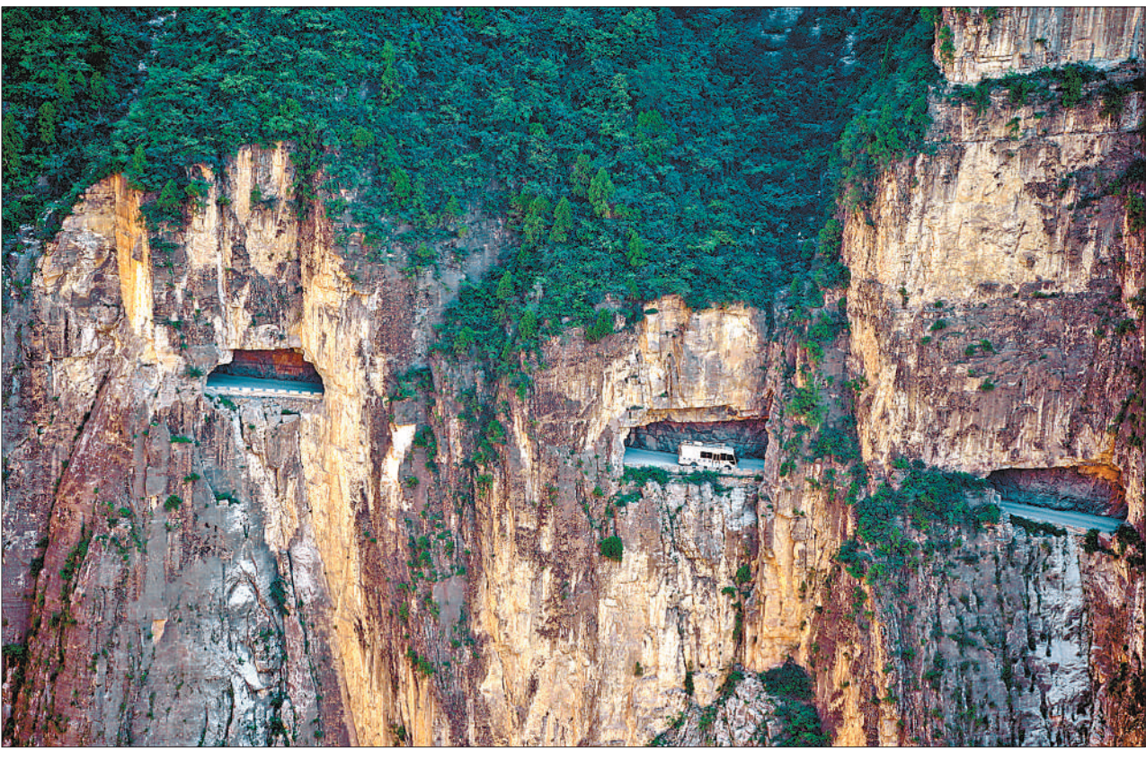
7月9日,山西省平顺县神龙湾村峭壁,车辆行驶在“太行天路”上。为了走出大山,村民们用15年时间在悬崖峭壁上开凿了一条长1500多米的“太行天路”。如今,这条路已成为当地的旅游一景。

“养老保险实现全国统筹后,将从制度上解决基金的结构性矛盾,制度将更加公平更可持续,养老金按时足额发放更有保障,转移接续更加方便快捷。”董克用说。