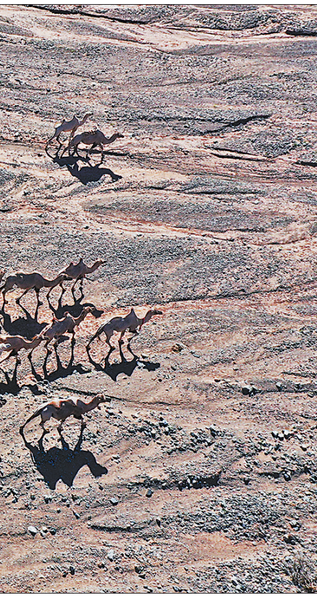
7月7日,甘肃省阿克塞哈萨克族自治县红柳湾镇加尔乌宗村牧民饲养的数百头骆驼前往夏季牧场。