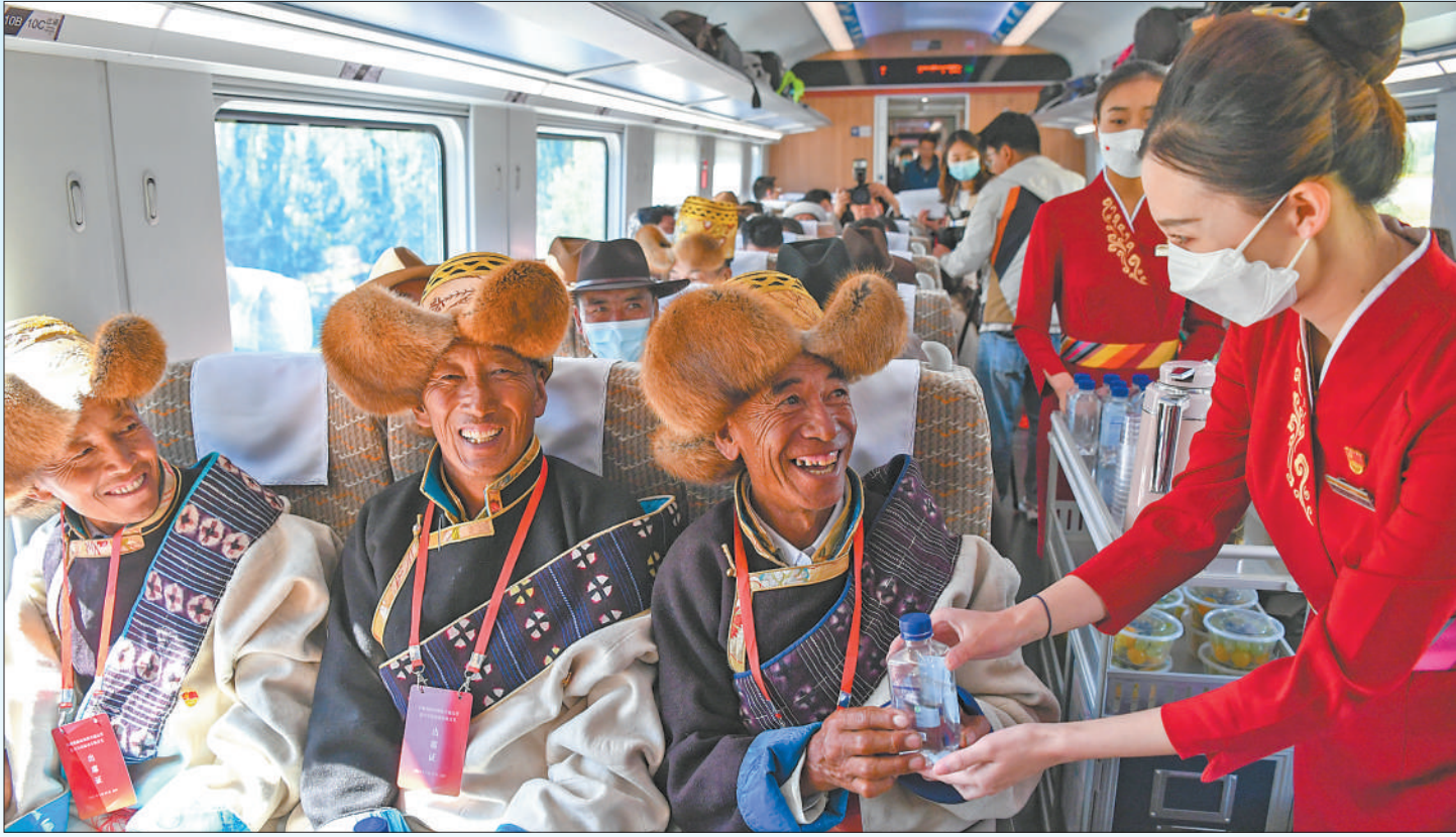
西藏首条电气化铁路——拉林铁路近日开通运营