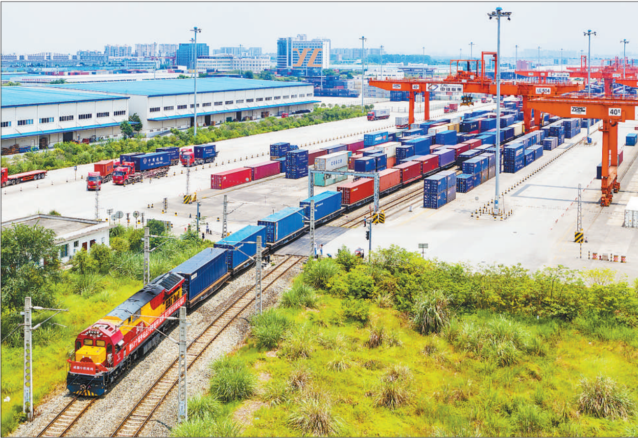
7月12日，一列满载集装箱的中欧班列从成都国际铁路港驶出，将发往波兰斯瓦夫库夫。成都至斯瓦夫库夫线路为成都首列宽轨直达欧洲腹地的中欧班列。至此，成都中欧班列线路网络已增至63个境外站点城市。

（本报北京、开罗、华沙、墨西哥城、里约热内卢、河内、莫斯科、约翰内斯堡、阿布贾7月12日电 记者龚鸣、黄培昭、于洋、刘旭霞、李骁晓、杨晔、张光政、闫福明、姜宣）