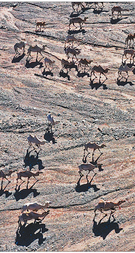
7月7日,甘肃省阿克塞哈萨克族自治县红柳湾镇加尔乌宗村牧民饲养的数百头骆驼前往夏季牧场。

“农田整治后,平均每块田都在5亩以上,大小农机都能开进农田里,并且在统一种植标准的情况下,稻谷销售价1斤至少高出6分钱。”