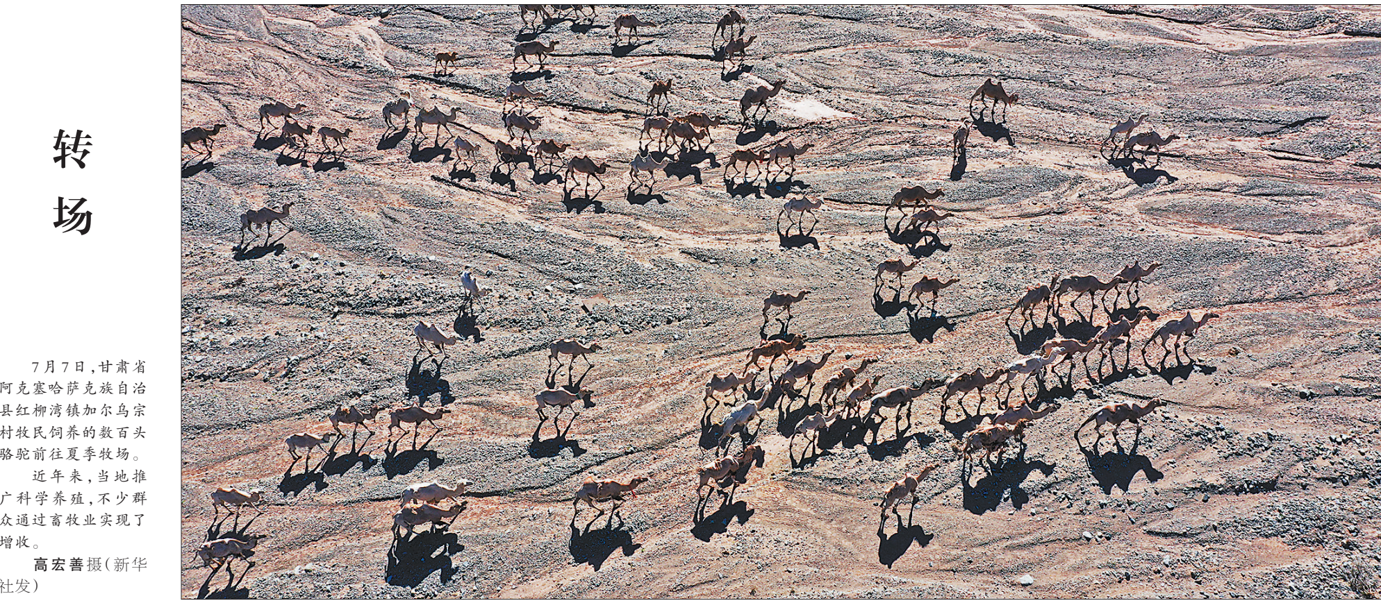
7月7日,甘肃省阿克塞哈萨克族自治县红柳湾镇加尔乌宗村牧民饲养的数百头骆驼前往夏季牧场。