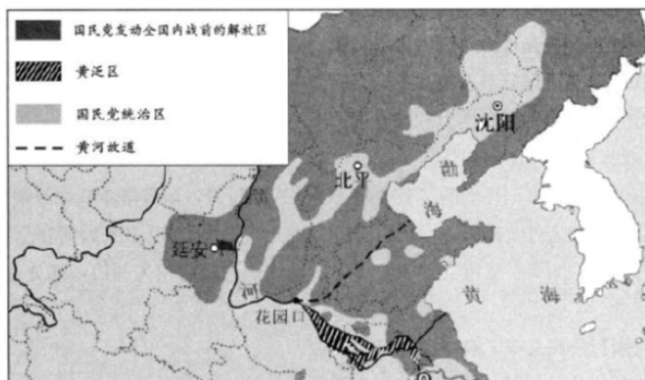
图 2 1946 年 6 月的国内形势图(局部)

8. 1938 年 6 月，国民党军队炸开黄河花园口大堤企图阻滞日军，形成了“黄泛区”。1945 年冬，国民党当局决定引黄河水回归故道，提出堵塞花园口决堤口与引导黄河改道同时进行的方案，以“解除黄泛区人民灾难”。中共则提出先恢复黄河故道的堤岸，再堵塞决口，并给予黄河故道区域民众经济补偿的提议(如图 2 所示)。后者的提议