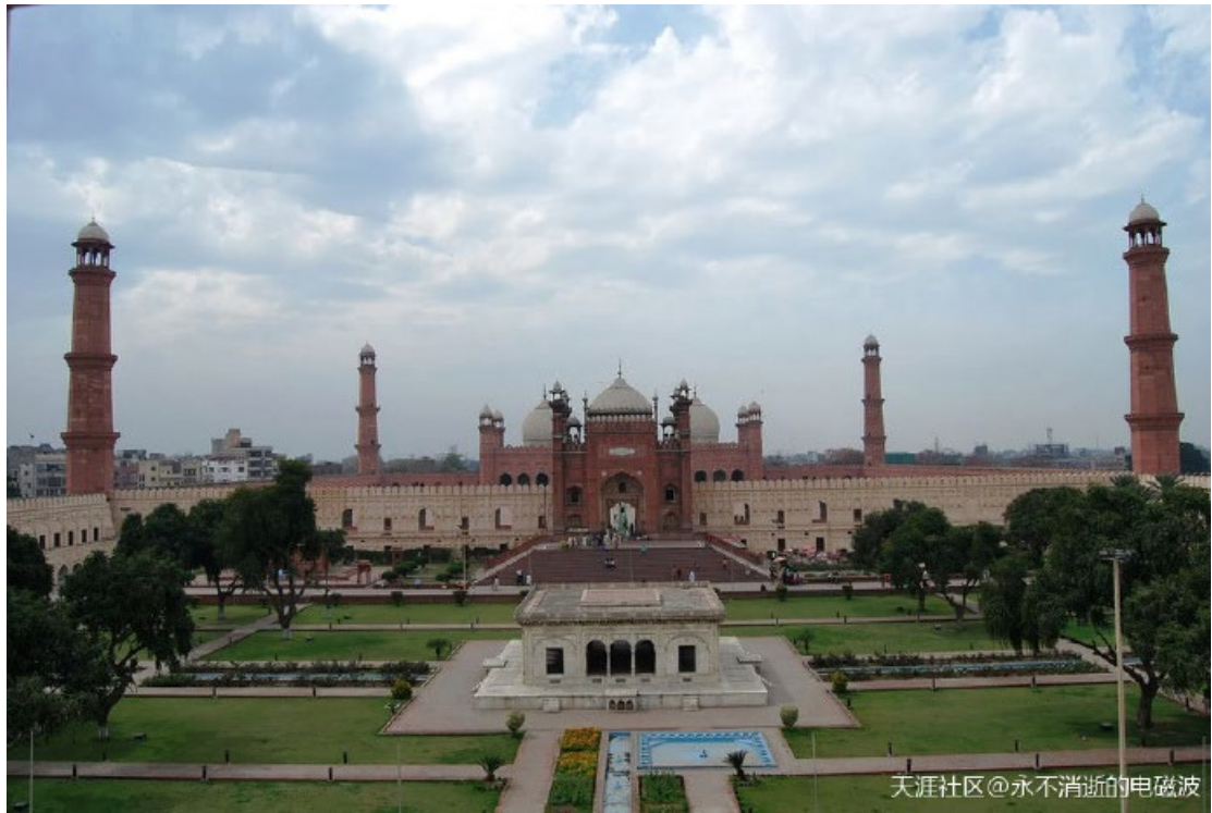
天涯社区@永不消逝的电磁波