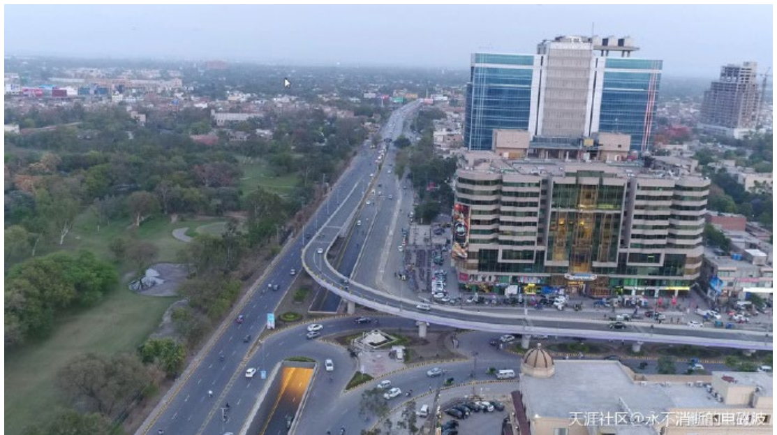
天涯社区@永不消逝的电磁波