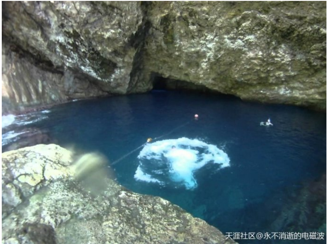
天涯社区@永不消逝的电磁波