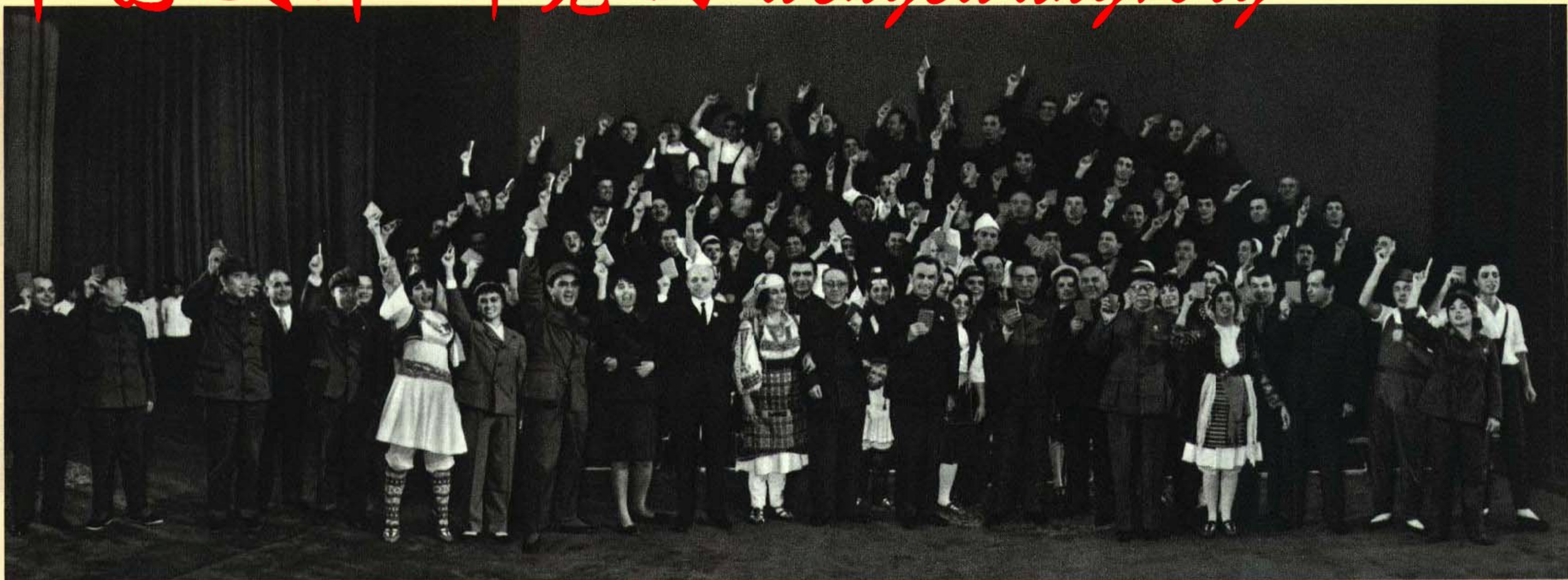
中共中央政治局常委周恩来、陈伯达、康生，政治局委员（以姓氏笔划为序）吴法宪、姚文元、黄永胜、谢富治，政治局候补委员纪登奎，同中国人民解放军指战员、首都革命文艺工作者和首都其他革命群众数千人，十一月二十七日晚在人民大会堂观看了阿尔巴尼亚人民军艺术团的精彩演出。图为：演出结束后，周恩来、陈伯达、康生等中央负责同志走上舞台和演员合影。