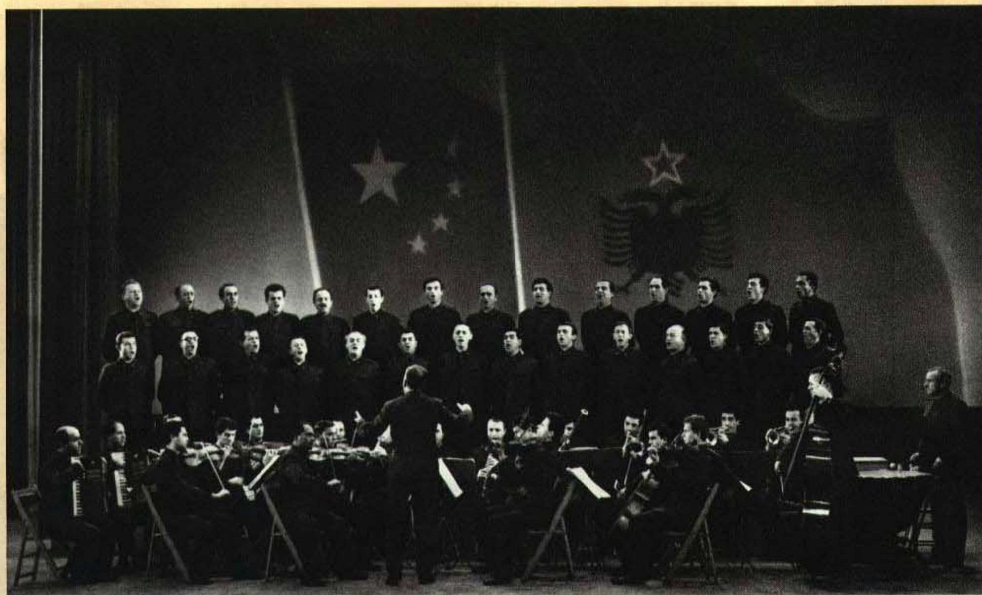
合唱 阿尔巴尼亚文艺工作者热情地歌颂了阿尔巴尼亚人民的伟大领袖恩维尔·霍查同志和中国人民的伟大领袖毛主席，歌颂了中阿两国人民牢不可破的战斗友谊。

阿尔巴尼亚文艺工作者观看了京棉三厂毛泽东思想宣传队演出他们自编的《庆祝阿尔巴尼亚解放二十五周年》文艺节目后，到后台和工人们一起高呼：“毛主席万岁！”“恩维尔·霍查同志万岁！”