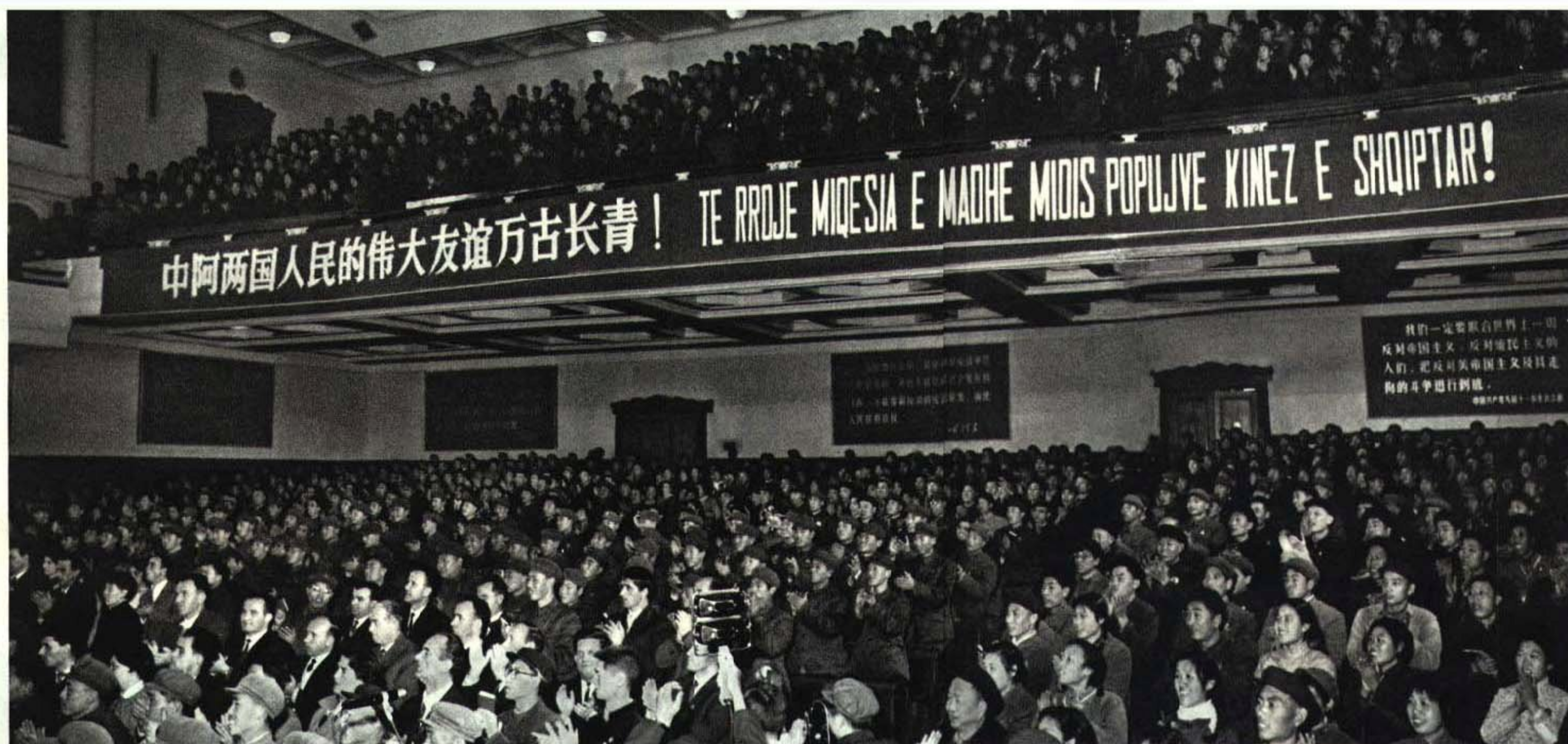
左下图：中国阿尔巴尼亚友好协会和中国人民对外友好协会，一九六九年十一月二十五日，在北京举行“阿尔巴尼亚电影周”开幕式。

这是谢富治副总理(右二)、郭沫若副委员长(右一)和阿尔巴尼亚驻中国大使罗博(右三)在开幕式上。