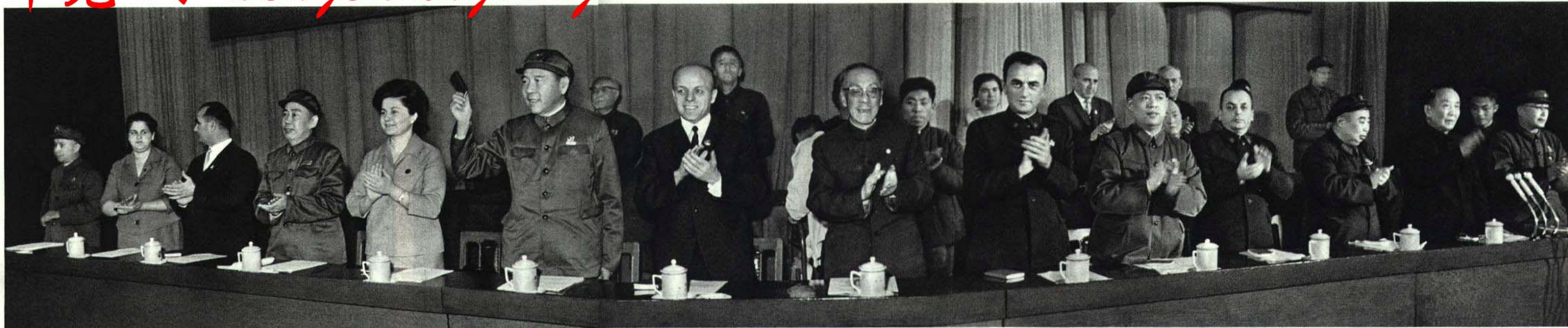
我国首都革命群众一九六九年十一月二十八日隆重集会，热烈庆祝阿尔巴尼亚祖国解放二十五周年。

中共中央政治局常委康生，中共中央政治局委员、中国人民解放军总参谋长黄永胜，中共中央政治局委员姚文元，中共中央政治局委员、国务院副总理、北京市革命委员会主任谢富治，中共中央政治局委员、中国人民解放军副总参谋长吴法宪，中共中央委员、人大常委会副委员长郭沫若，出席了庆祝大会。