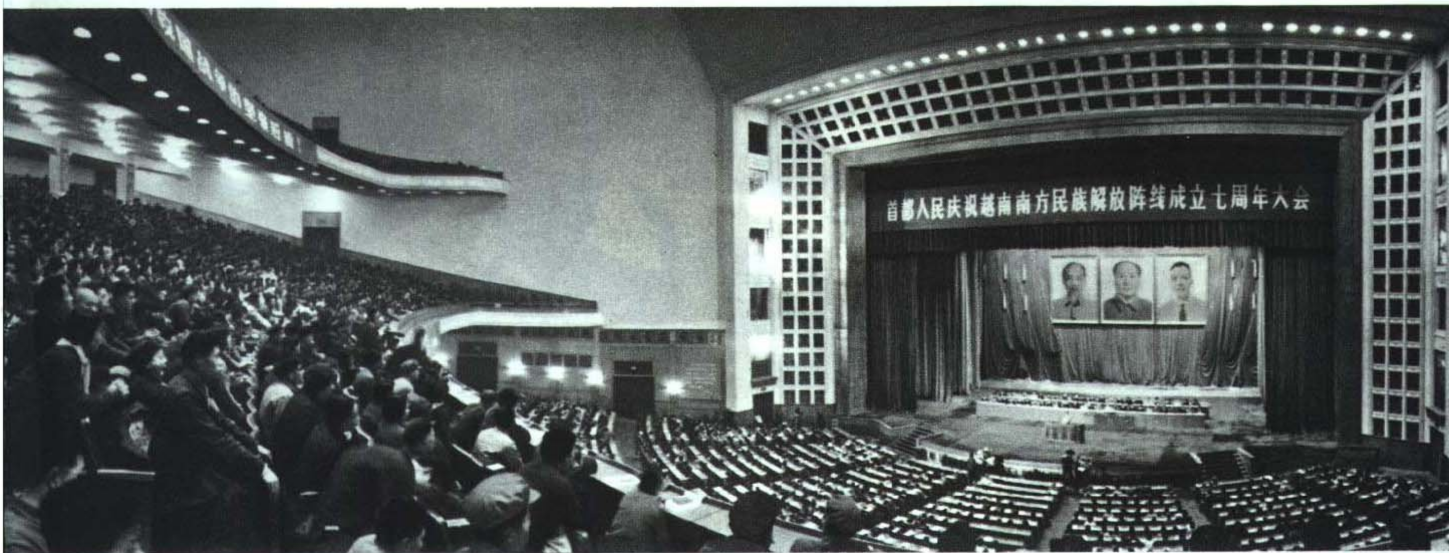
我国首都人民庆祝越南南方民族解放阵线成立七周年大会会场。

周总理强调说，七亿中国人民是越南人民的坚强后盾，辽阔的中国领土是越南人民的可靠后方。美帝国主义不管怎样横行霸道，它过不了三千一百万越南人民这一关，它过不了七亿中国人民这一关。今后，不论在前进的道路上会遇到什么样的