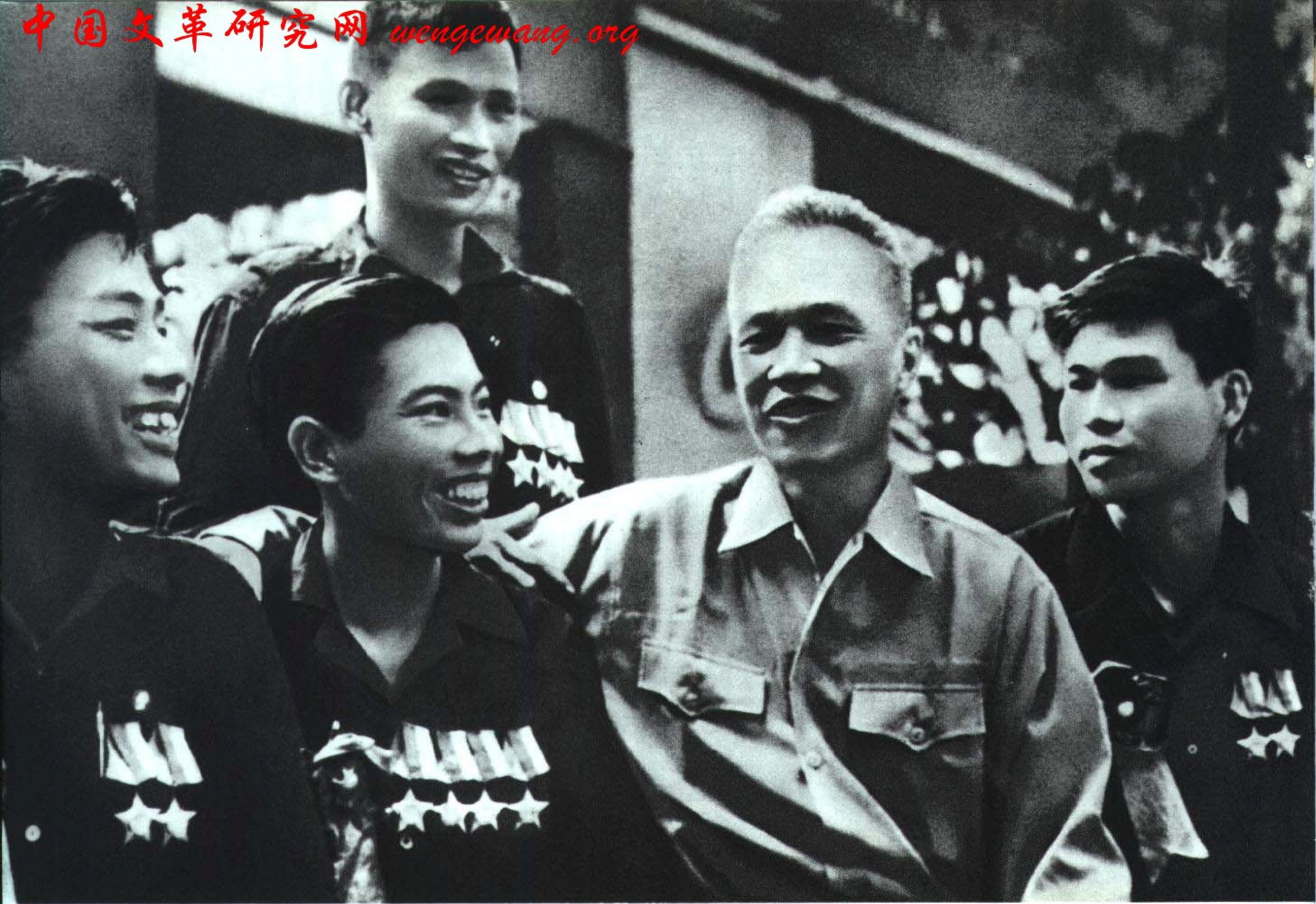
越南南方民族解放阵线中央委员会主席阮友寿主席同解放武装力量的英雄模范一起亲切交谈。