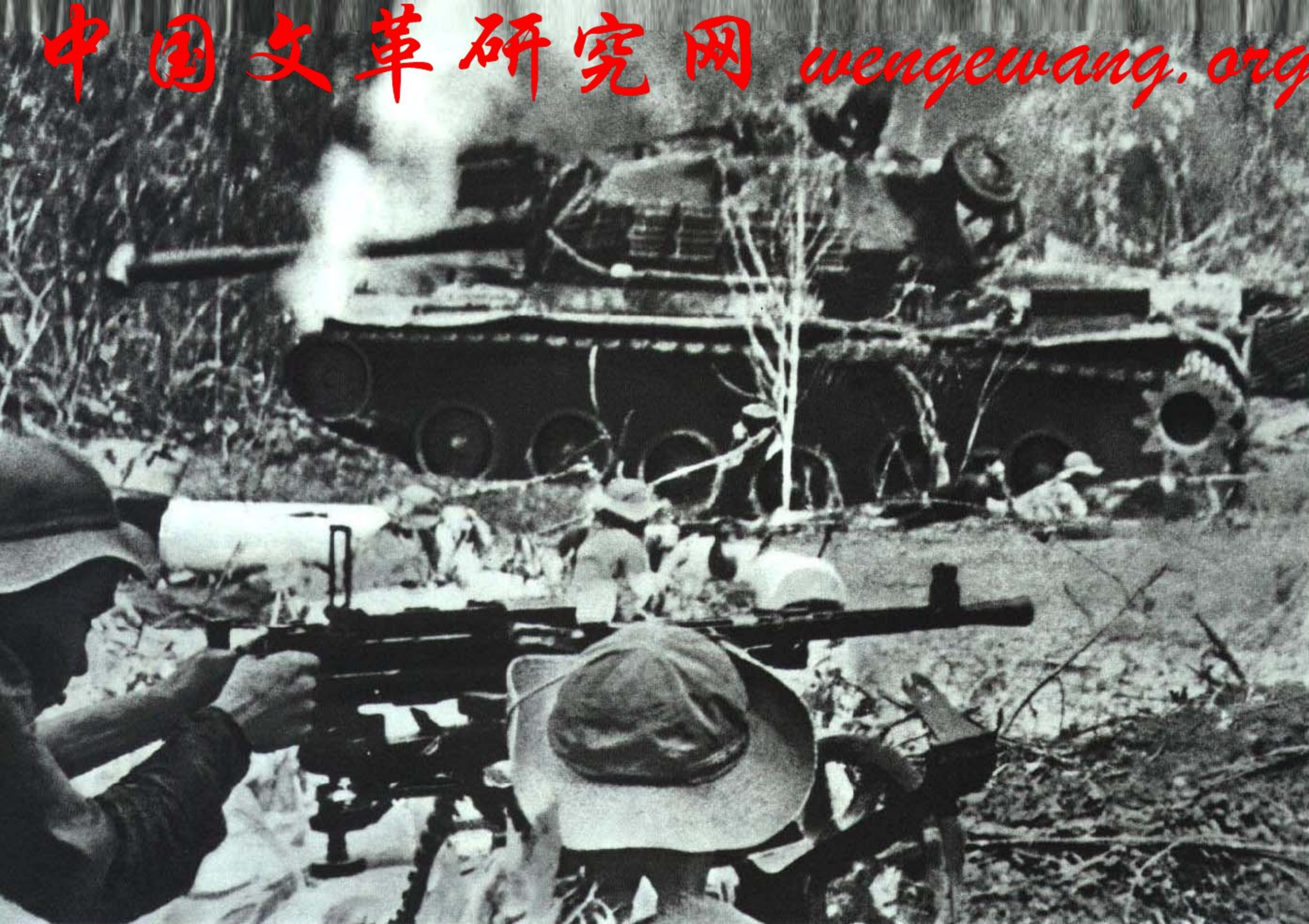
越南南方人民解放武装力量的战士发起迅猛凌厉攻势，杀得美国强盗丢盔弃甲，狼狈逃窜。